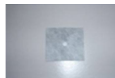
PRIMUS BANDĂ ETANȘARE ARMARE (BHF82) 120 x 120

Super-elastice Impermeabile Ușor de aplicat/montat Rezistente în mediu alcalin