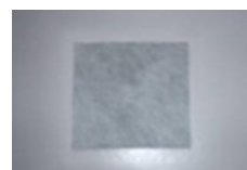
PRIMUS BANDĂ ETANȘARE ARMARE (BHF82) 400 x 400